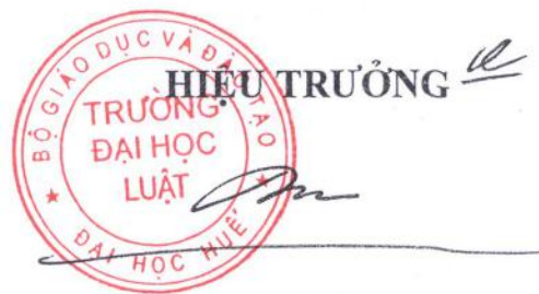
Đoàn Đức Lương